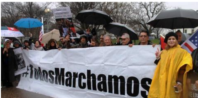
Campaña interna con respaldo mundial