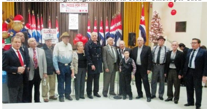
Al final varios asistentes cantando "La Montaña".