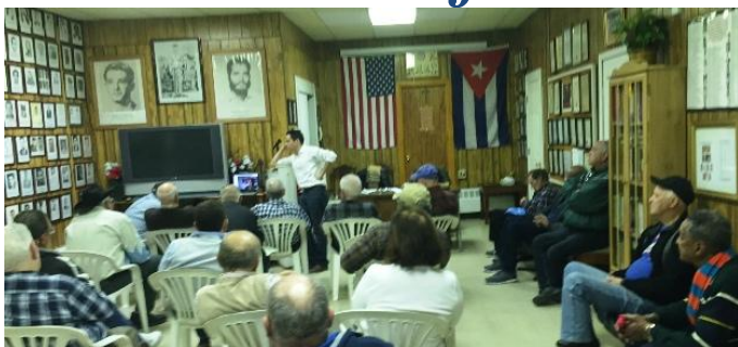
Local de la UEPPC Noviembre 24, 2015.